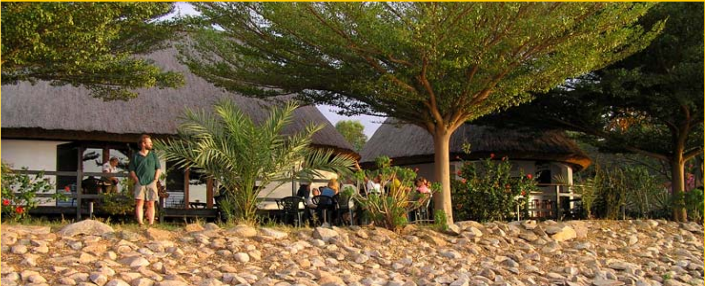
Bildet: Speke Bay Lodge ligger ved den enorme Victoriasjøen. Her kan du nyte solnedgangen i vest, et godt måltid og god drikk i restauranten. Neste morgen blir vi rodd til en fargerik landsby i nærheten.

Dag 8: Etter frokost ute på restaurantens terrasse like ovenfor strandkanten er det å kjøre sydøst mot Serengeti National Park. Vi har god tid til å stoppe og se på alle de spennende dyr som lever her, slik som løver, geparder, elefanter, sjiraffer, gnuer, bøfler, sebraer, flere arter hjortedyr, aper, øgler, flodhester, krokodiller og mange slags fugler - store og små. Du er garantert å se alle disse dyrene - opptil flere ganger i løpet av den tiden du oppholder oss på Serengeti! Du kjører til Seronera Wildlife Lodge ( bildet under ) som ligger midt ute på Serengeti. Dette er et helt spesielt hotell med arkitektur tilpasset noen enorme steiner i slettelandskapet. Her spiser du en kjempegod afrikansk middag fra et bugnende buffébord. Her kan du oppleve at villdyrene, både løver og elefanter og hyener slår seg til inntil hotellveggen. Apekattene føler seg svært så hjemme, og viser gjerne opp sine streker like utenfor restaurantvinduet.