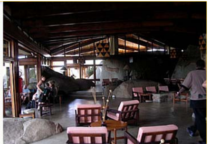
Bildene: Seronera Wildlife Lodge ligger midt ute på Serengeti. Dette er et spesielt hotell designet etter naturen, og bygget mellom kjempestore steiner som er høyere enn hotellet. Blant annet fra restauranten og baren er det utsikt over de langstrakte slettene som Serengeti er.